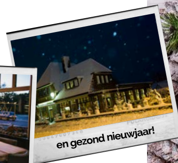
en gezond nieuwjaar!