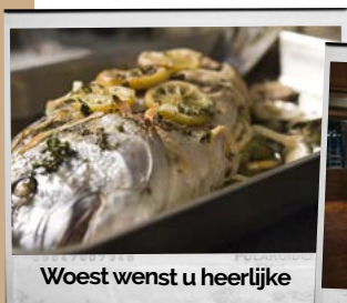
Woest wenst u heerlijke