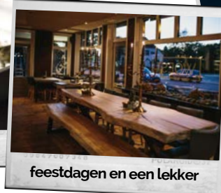
feestdagen en een lekker